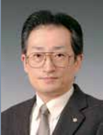
龍田 恒康 Tsuneyasu Tatsuta